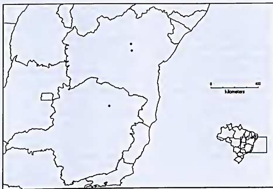
Figura 2 - Distribuição geográfica de Polygala fontellana Marques & Aguiar.

Polygala fontellana está restrita, até o momento, a Cadeia do Espinhaço nos estados da Bahia e Minas Gerais (Fig. 2), sendo encontrada em altitudes de 750–1150 m s.m., em formações de campo rupestre, com flores e frutos nos meses de fevereiro, junho, julho,